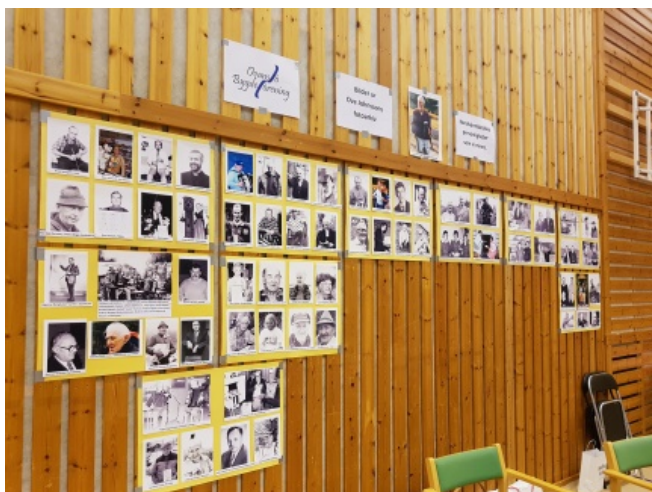
Vår fotoutställning "Nordvärmäländska personligheter, som vi minns" uppskattades av de många besökarna vid vårt bord.