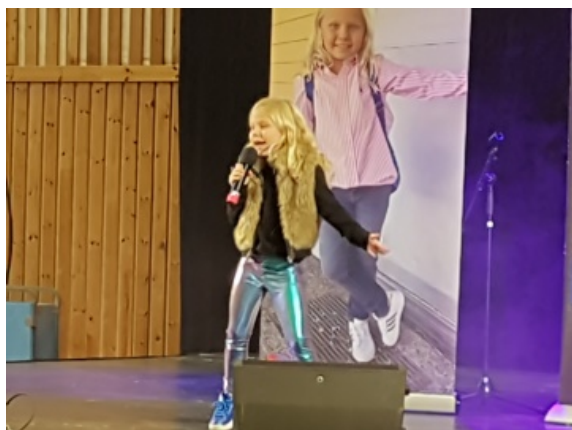
För underhållningen stod bl.a. Maja Söderström, känd från julkalendern 2018.